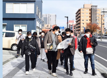
山形でのまち歩きの様子