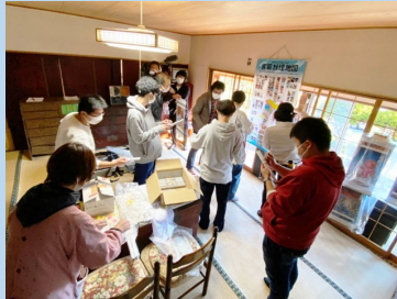
旧守屋邸妖怪展での展示作業の様子