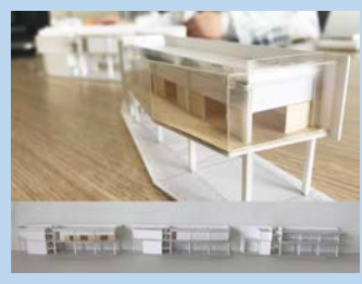
写真1 観光協会兼合宿所の提案スタディ

Pick Up Lab 竹内研究室 では4年時に建築学の書籍輪読の上、各自テーマを設定し卒業論文を作成。建築への理解を深め、卒業設計を行いました。大学院では、学部から進めているプロジェクト、伊豆某海岸環境整備計画と併せ観光協会兼合宿所の提案プロジェクトを引き継いでいます。また、他学問の視点を大切にしています。最近では文化人類学等書籍の輪読を行いました。国内外の他大学との交流の機会にも恵まれ、東南アジア・インドネシア研究にも参加しています。様々な調査作業から、地域ないしは建築空間を分析し考える力が身につきます。竹内研究室は、様々なアプローチで「建築」に気付くことのできる研究室です。(M1堀)