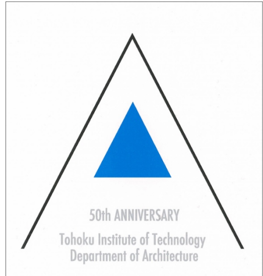
佳作 鳴海 徹