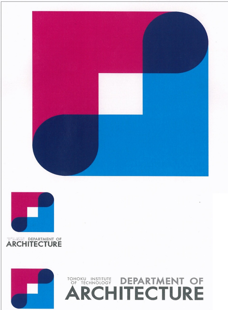
最優秀賞 伊川 真一