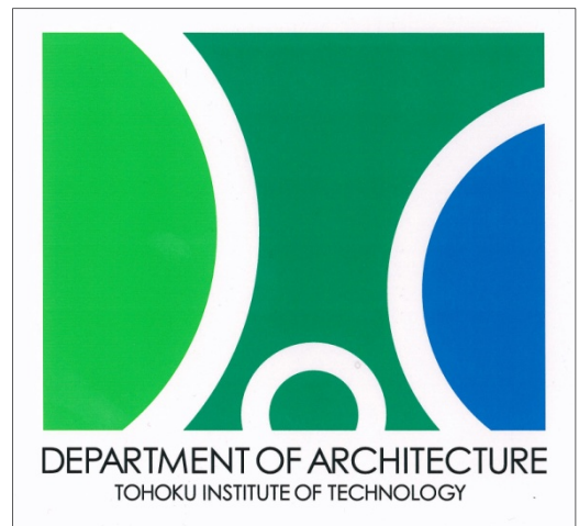
佳作 黒川 潔