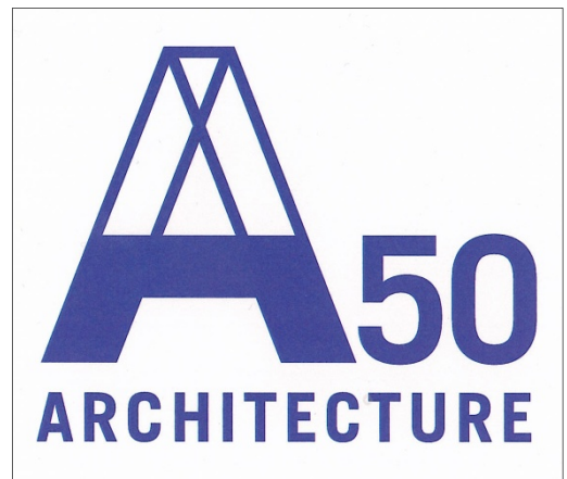
佳作 今井 龍太郎